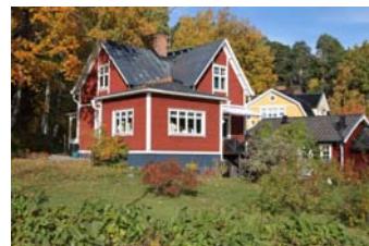
Huset är idag rött. Den glasade serveringslokalen är idag inpanelad sånär som på ett par fönster.