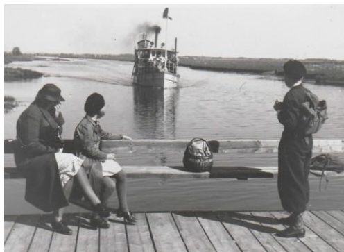
Väntan på båten, Ultuna brygga 1938.