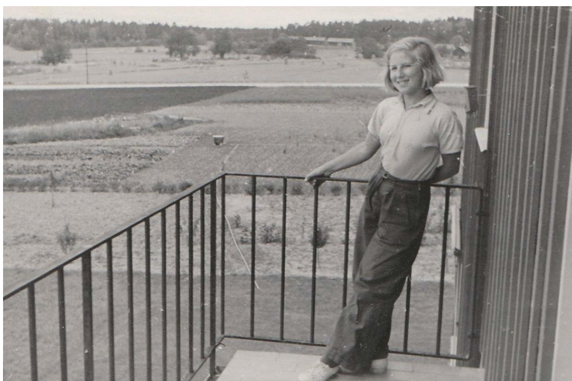
På balkongen på nya stället 1940, utsikt över Ultunafälten och Dag Hammarskjölds väg.