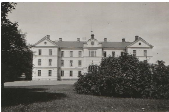
Lantbruksinstitutet "Kåken" från 1800-talet.