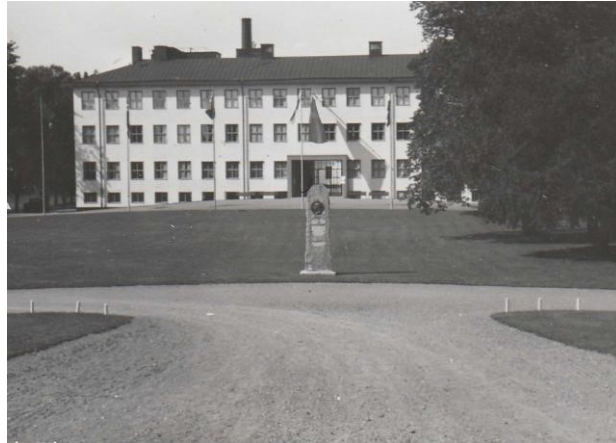
Ultuna Lantbrukshögskola, "Depris", 1935.