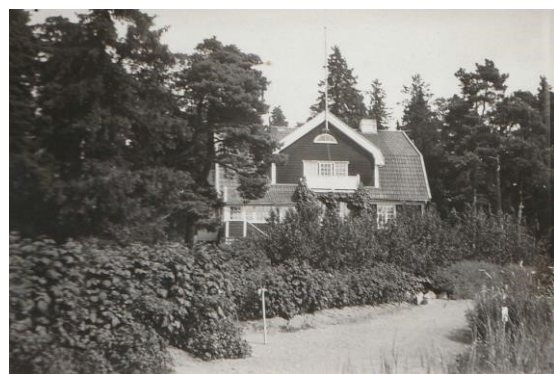
Röda villan, "Fyllan", från 1912.