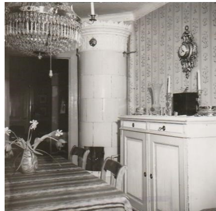
Vår matsal med kakelugn.