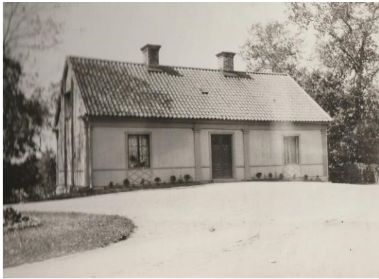
Lilla östra flygeln på stora gården, 1930-tal.