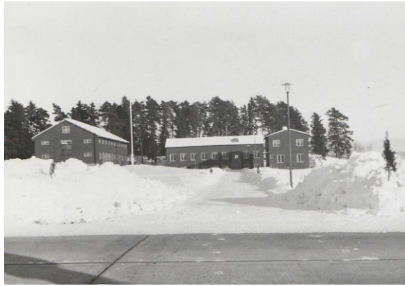
Svalövsfilialen i snö och kyla under krigsåren.