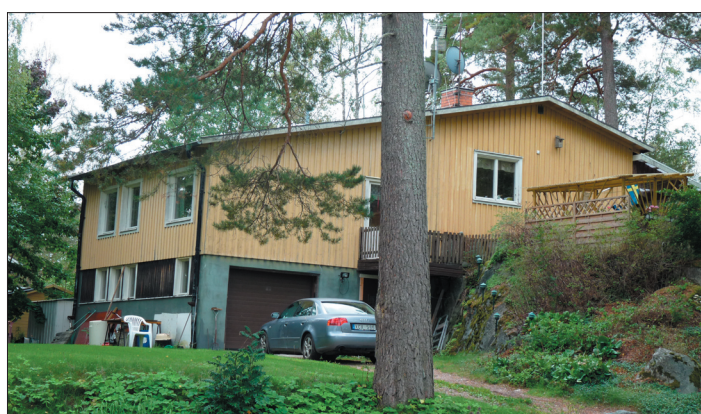
Huset 2018 från samma håll som bilden till vänster.