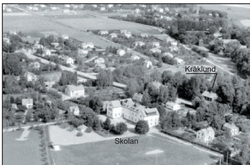
Flygfoto över Sunnersta 1936. Kråklund ligger mittemot skolan.