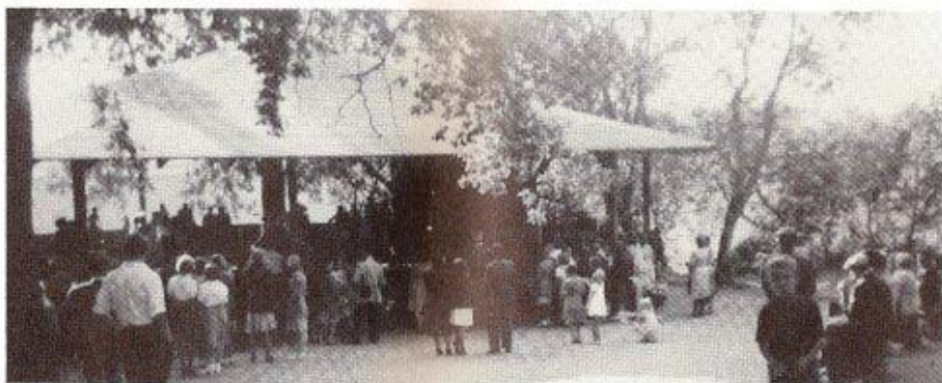
Den Gamla Dansbanan (Rotundan) var belägen där den nuvarande dansbanan ligger. För att få dansa var man tvungen att lösa "dansbiljett" för varje enskild dans.