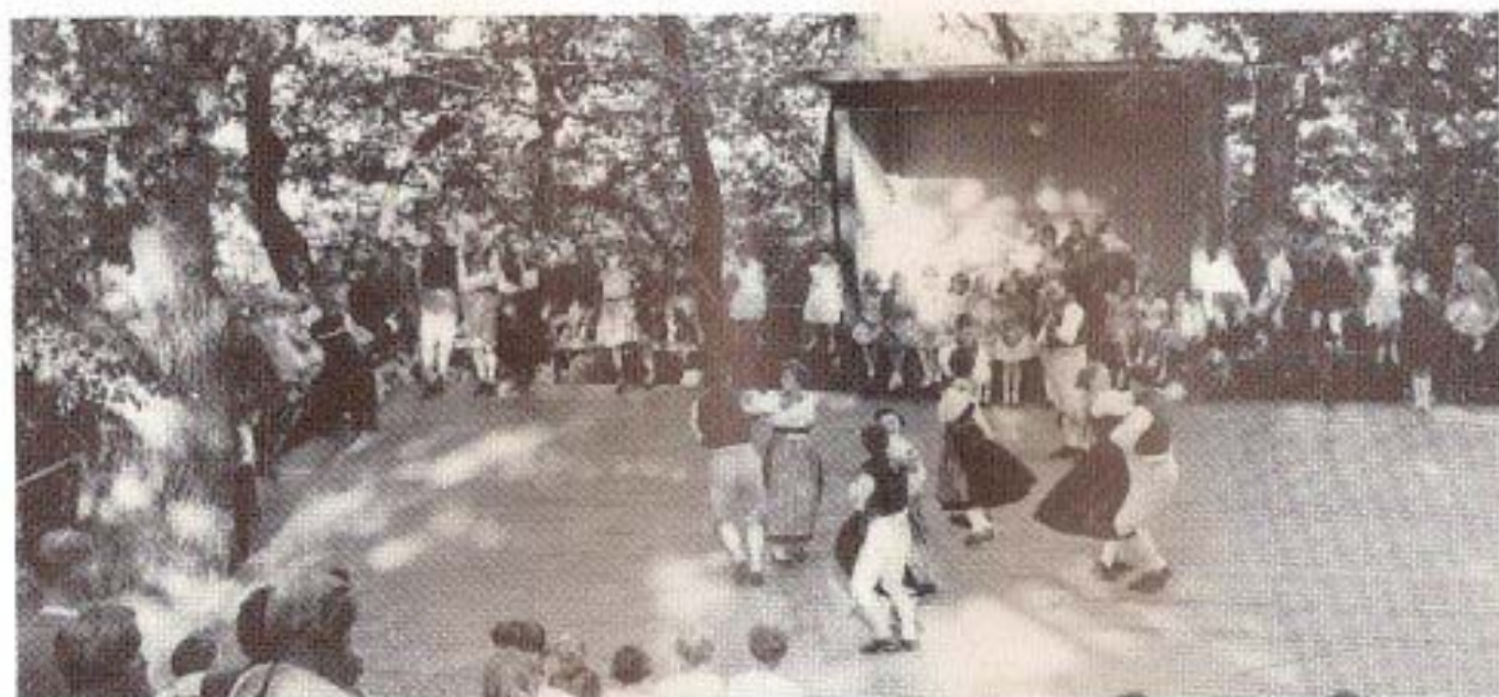
Gammeldansbanan med sittplatser, där folkdansuppvisning och bygdespel framfördes. Dansbanan ligger mycket vackert mellan Fyrisån och Höganloftsstugan.

I början på 80-talet byggdes dansbanan in med ljudabsorberande väggar för att på det sättet få ner ljudvolymen för de kringboende grannarna.