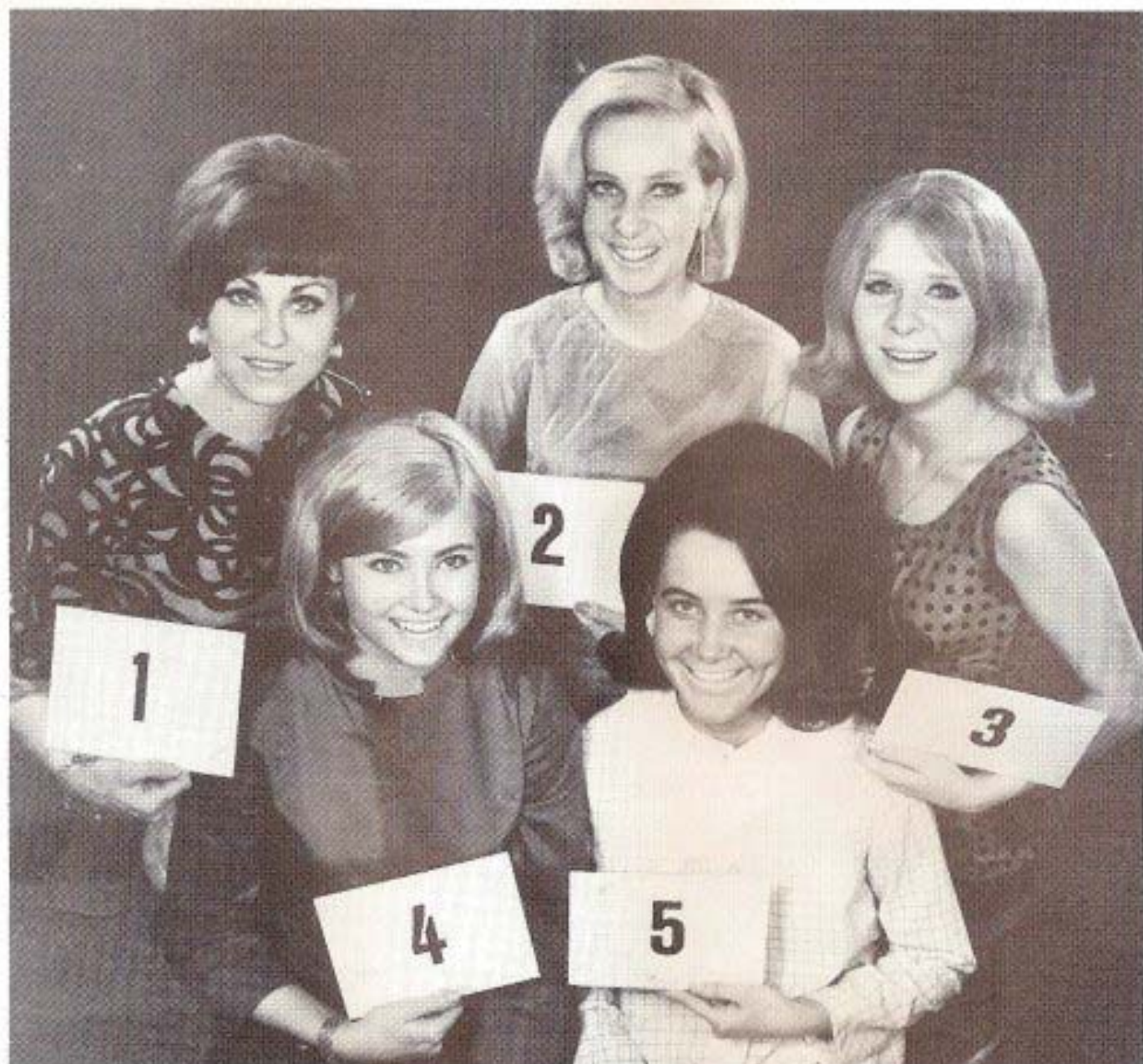
Miss Konvalj kandidater 1967.